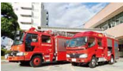
更新される救助工作車、ポンプ車

相生消防署に 配備されているポン プ車、救助工作 車が車両の更新に 伴い、災害現場の 最前線で活躍す るのも残り僅かと