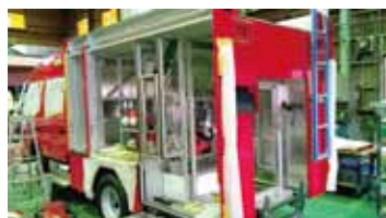
製作中の車両の様子

』配備を、職員一同心待ちにしています。今後は、私たちの手となり足となり、災害現場で共に闘ってくださることでしょう。